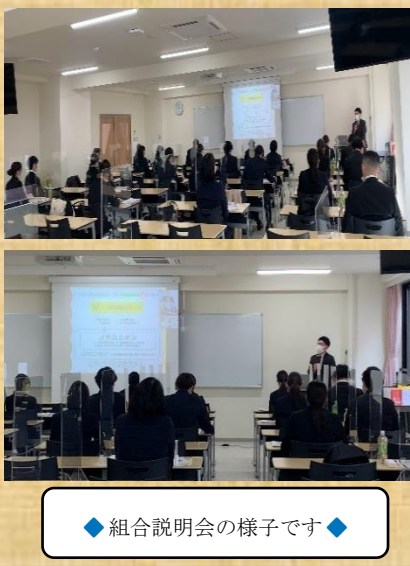
◆ 組合説明会の様子です ◆

令和5年4月1日(土)、つしま医療福祉グループ合同入社式が日本医療大学大講堂にて開催されました。グループ全体として、北海道地区24名、東京・千葉・仙台地区8名、合計32名の新卒者が新たにノテユニオンの仲間になりました。同日、午後から「労働組合説明会」を実施し、組合の組織構成や取り組みなどについて説明をさせて頂きました。皆様のこれからの活躍を期待しています。また、令和5年4月21日(金)には、外国人技能実習生の方々に向けた入職オリエンテーションが行われ、その中で「労働組合説明会」を実施しました。当日は、外国人実習生向けに翻訳した説明資料を用意し、通訳の方の協力を得ながら組合の概要などを説明しました。説明に対し、しっかりと視線を向けて話を聞いている皆さんの姿勢は素晴らしいです。4月24日(月)から、各事業所に配属となり、技能実習を進めています。日本での生活、仕事など苦労することもあるかと思いますが、本来の目的でもある自国に日本の介護技術を持ち帰ってもらえるように頑張ってもらいたいと思います。新たな仲間として、皆さん、これからもよろしくお願ひ致します。